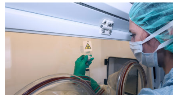
Programme DPC n°99K72325004