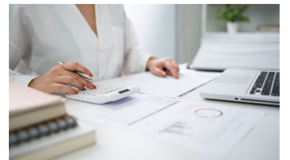
Programme DPC n°99K72325008